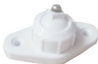
MB-100:旋转式墙壁安装支架